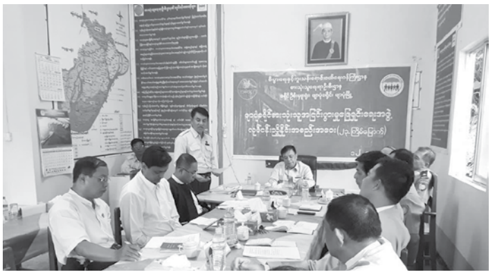
တစ်လနှစ်ကြိမ် ဆိုင်(၁၀)ဆိုင်အား လစဉ် စစ်ဆေးမှုတွင် တိုးတက်မှုရှိကြောင်း၊ မုန့်မျိုးစုံဆိုင်၊ ကုန်ခြောက်ဆိုင်၊

အတွင်း ခရိုင်အငြင်းပွားမှုဖြေရှင်းရေးအဖွဲ့၏ ကွင်းဆင်း ဆောင်ရွက်မှုနှင့် အောက်တိုဘာလအတွင်း ကွင်းဆင်းဆောင်ရွက်မည့်အခြေအနေများ၊ မြို့နယ်အလိုက် ကွင်းဆင်းဆောင်ရွက်မှုနှင့် ဆောင်ရွက်မည့်အခြေအနေများ၊ မြို့နယ်အလိုက် ကွင်းဆင်းဆောင်ရွက်မှုနှင့် အောက်တိုဘာလအတွင်း ကွင်းဆင်းဆောင်ရွက်နိုင်မည့် အခြေအနေများ၊ မြို့တွင်း လက်ဖက်ရည်ဆိုင်များနှင့် စားသောက်ဆိုင်များအား ခရိုင်အငြင်းပွားမှုဖြေရှင်းရေးအဖွဲ့က စားသုံးသူများ ဘေးဥပဒ်အန္တရာယ်ကင်းရှင်းစေရန်