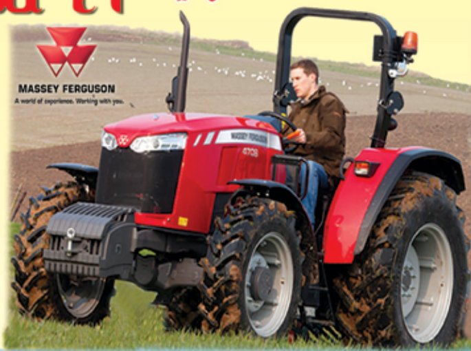
MASSEY FERGUSON A world of experience. Working with you.

တစ်လုံးချင်းမှ စတင်ပေး (၃၀ ကောင် မှ ၁၂၀ ကောင်အထိ) ထွန်စက် Service and Warranty