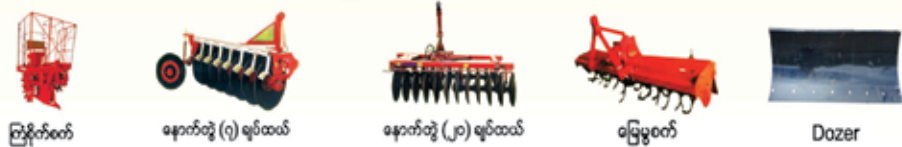
TS-404, MD-554, MD-704, TS-904

ထွန်စက် နောက်တွဲ (၇) စက် နောက်တွဲ (၂၀) စက် ပြေပျံစက် Dozer